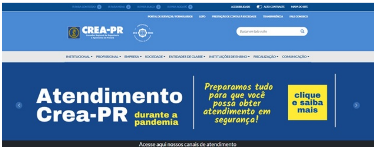
Figura 1- campanha do Crea-PR para atendimento seguro durante a pandemia

Assim, houve um esforço importante de tecnologia para manter em operação todos os tipos de processos, inclusive o atendimento ao público, preservando os colaboradores e todos os usuários. Esse esforço tanto possibilitou a manutenção de todas as operações, que mesmo nos momentos em que o retorno às atividades presenciais foi autorizado em algumas localidades, optou-se por manter as operações remotas, visando a contribuir com a redução da curva de contágio e preservar a saúde dos colaboradores.